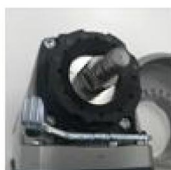
GWS 18V-LI 나사 체결 방식